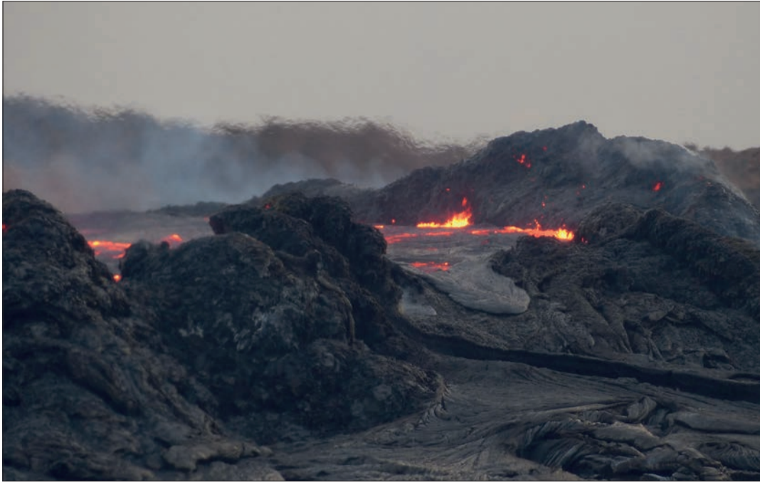
Le volcan Erta Ale, en Ethiopie, prises en novembre 2016