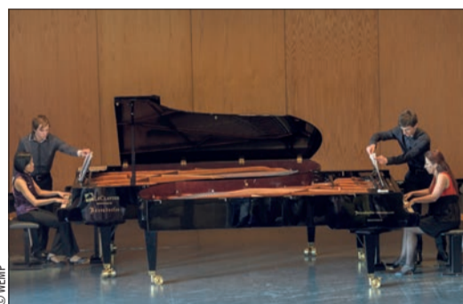
Une première: un tournoi open de piano, ludique et bienveillant, sera proposé à 16 pianistes