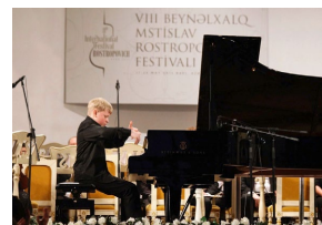
Au Festival international Mstislav Rostropovitch, après avoir remporté le premier prix du 8 e Concours international Tchaïkovski pour jeunes musiciens en 2014.