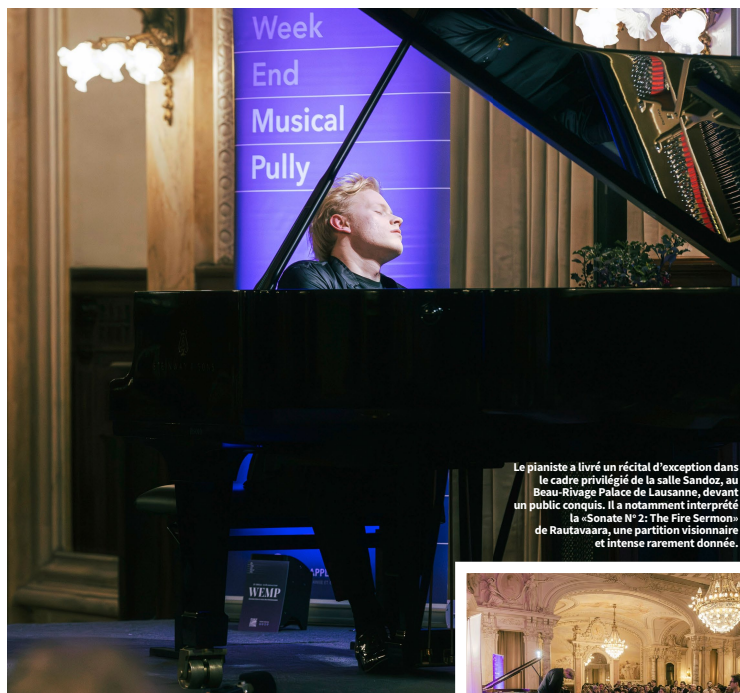
Le pianiste a livré un récital d'exception dans le cadre privilégié de la salle Sandoz, au Beau-Rivage Palace de Lausanne, devant un public conquis. Il a notamment interprété la «Sonate N° 2: The Fire Sermon» de Rautavaara, une partition visionnaire et intense rarement donnée.

Week-end musical de Pully, du 30 avril au 3 mai 2026, entrée libre à tous les concerts, wempully.ch