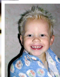
A l'âge de 2 ans. La période où il écoute sa grande sœur s'exercer au piano en permanence. Il commencera à en jouer trois ans plus tard.

fesseuse historique. «Nous sommes très proches, confie-t-il. Je lui envoie tous les enregistrements, avant de jouer un programme, ou après l'avoir appris. J'ai besoin d'entendre son avis, musicalement et psychologiquement.» Une façon effi-